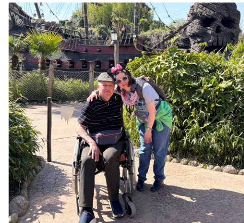
@ Phantasialand DE

Weitere Informationen unter: www.phantasialand.de/de/erlebnishotels/hotel-matamba