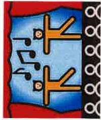
Mascott - Symbole © Ahnnete Klüßinger